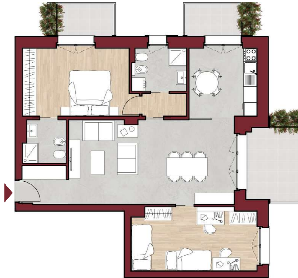
planimetria arredata scala 1:100