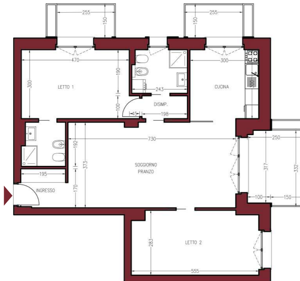
planimetria quotata scala 1:100